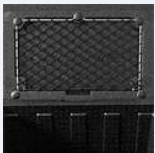
Red para placas eutécticas o hielo seco.