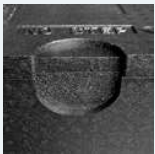
2 tiradores laterales